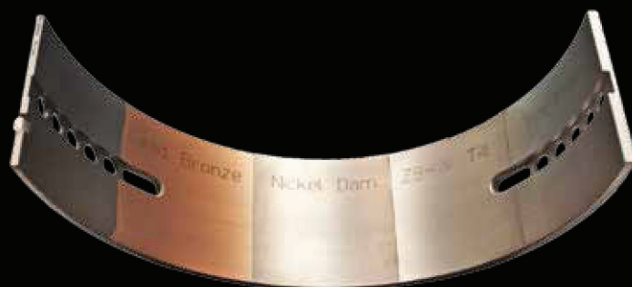
Вкладыш подшипника со слоями композитных материалов

Простейший вкладыш подшипника скольжения — биметаллический или изготовленный из пар: сталь-баббит, сталь-бронза или сталь-алюминий. Тонкий слой антифрикционного сплава, нанесенный на основу, обеспечивает значительно более высокую стойкость к статической и динамической нагрузке, чем при использовании одного вида металла. В биметаллических подшипниках скольжения для соответствия требуемым параметрам используются дополнительные слои материала, которые наносятся с помощью литья, гальванизации и других процессов. Именно так производятся подшипники скольжения с использованием многослойных композитных материалов.